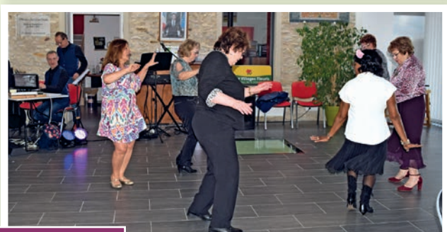
Un peu de danse pour terminer la journée !