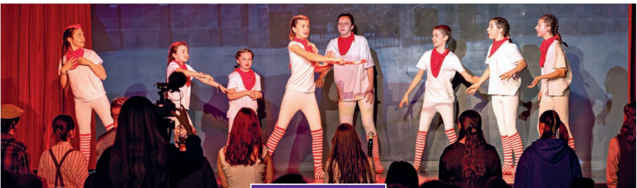
Charlie et la chocolaterie

« L'avenir appartient à ceux qui rêvent trop » Grand Corps Malade