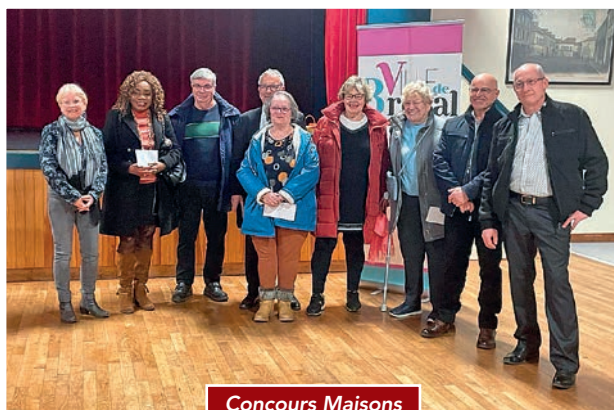
Concours Maisons Fleuries 2023