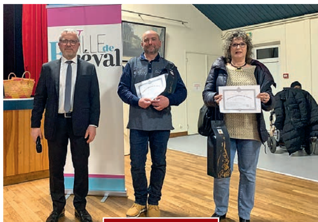
Médailles de travail