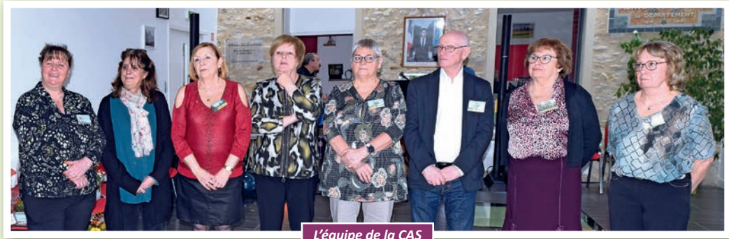
L'équipe de la CAS