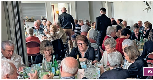
Bon appétit !