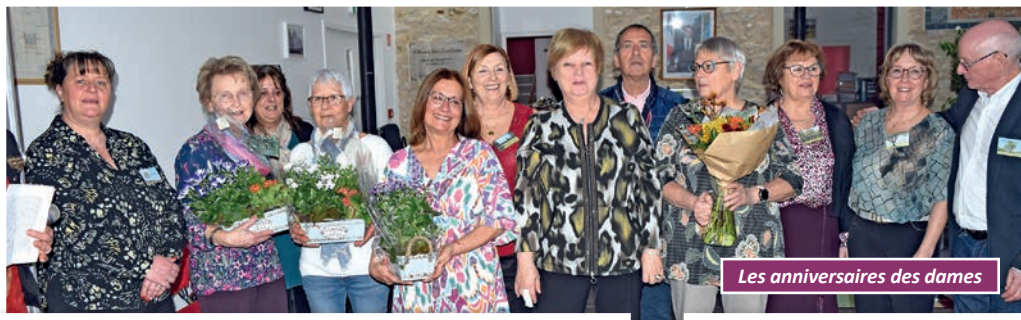
Les anniversaires des dames