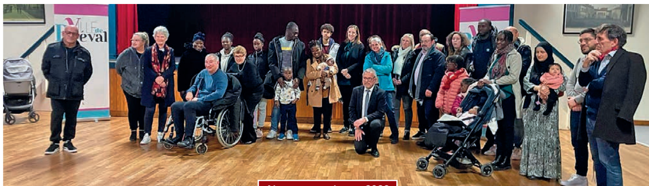
Nouveaux arrivants 2023