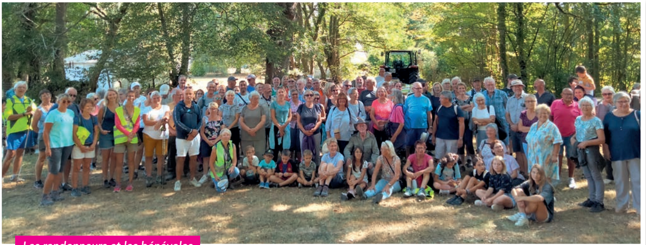
Les randonneurs et les bénévoles

Nous vous donnons rendez-vous le samedi 26 août 2023 pour la 9 ème édition !