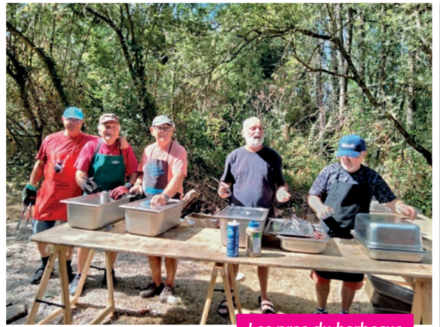
Les pros du barbecue