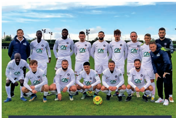
L'équipe fanion accède à la 4 ème division de District !

À noter également le très beau parcours de cette équipe en Coupe de France puisqu'elle a atteint le 4 ème tour de la prestigieuse coupe nationale.