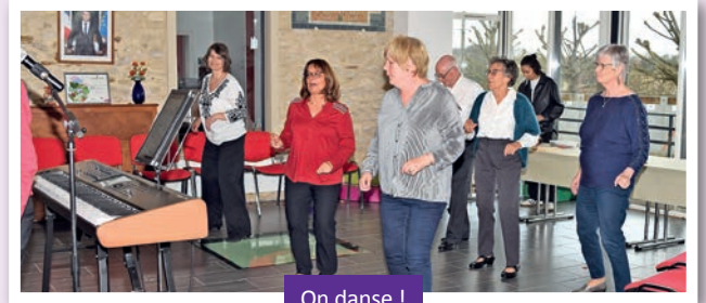
On danse !