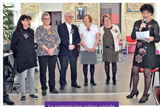
La commission action sociale