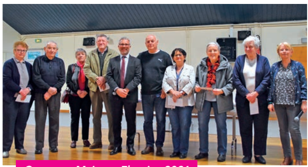
Concours Maisons Fleuries 2021

La soirée s'est achevée convivialement par un cocktail apéritif.