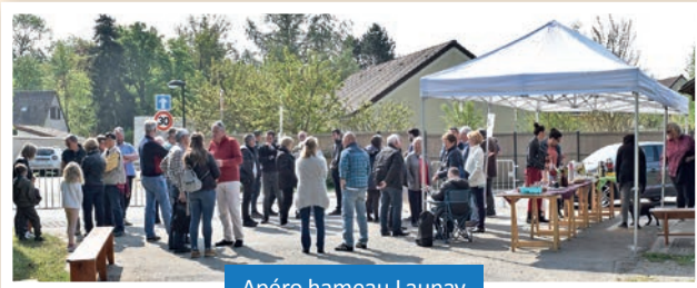
Apéro hameau Launay

Nous profiterons de cette Fête du Village pour accueillir les derniers nouveau-nés de la commune et les nouveaux habitants : si vous venez d'arriver, venez vous manifester en Mairie, pour vous faire connaître ! Cette Fête sera aussi l'occasion de remettre leur prix aux gagnantes du concours photos.