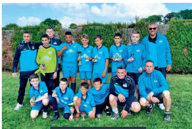
L'équipe A - catégorie U13

Le dimanche 8 mai, le tournoi U13 du Football Club a pu de nouveau avoir lieu au stade communal avec une belle ambiance sportive et un beau soleil. Tous les bénévoles ont mis la main à la pâte pour remettre au calendrier cet évènement incontournable de notre association.