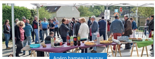
Apéro hameau Launay

teurs locaux grandir, et la fréquentation du public augmenter : nous sommes heureux d'offrir ainsi une vitrine conviviale aux producteurs et artisans « du coin » : Rendez-vous le samedi 28 mai, pour une édition encore plus fournie !