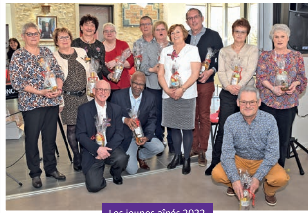
Les jeunes aînés 2022