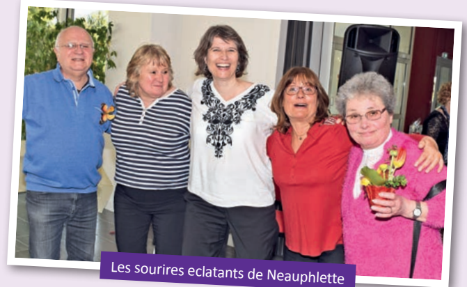
Les sourires éclatants de Neauphlette