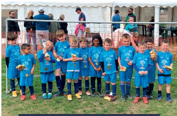
Les U6/U7 vainqueurs du tournoi d'Ezy/Eure

Côté sportif, nos jeunes pousses de la catégorie U6/U7 se sont distinguées récemment au tournoi de Pâques d'Ezy-sur-Eure en remportant le tournoi ! Toutes les catégories de l'école de football ont participé à cette épreuve.