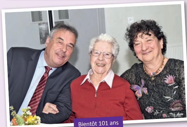
Bientôt 101 ans