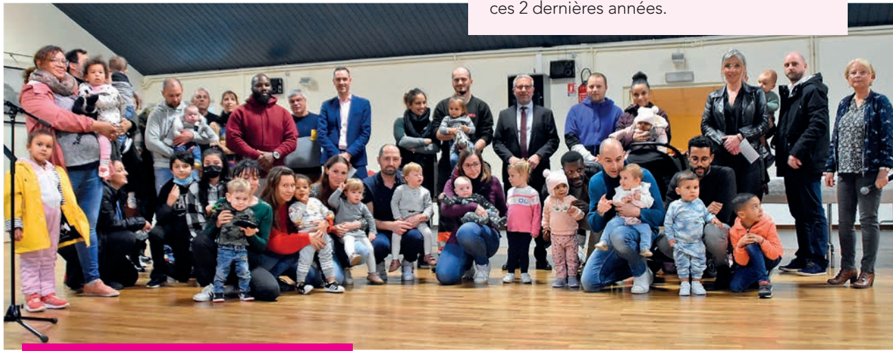
Remise des récompenses Bébéés 2020-2021

Nous avons débuté la cérémonie en fêtant les Bébéés nés en 2020 et 2021 . Les familles ont reçu un bon cadeau « Oxybul/Okaidi » de 30 €. 36 bébéés sont nés sur la commune ces 2 dernières années.