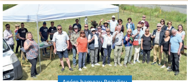
Apéro hameau Beaulieu